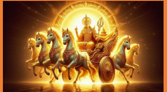
Shri Surya Deva Chalisa