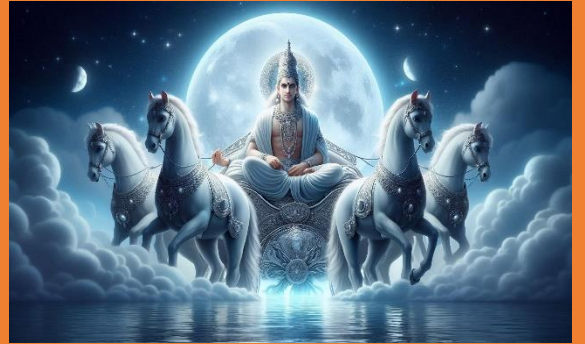
Shri Chandra Dev Chalisa