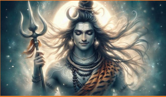
शिव तांडव जी स्तोत्र