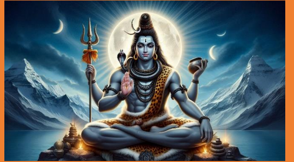
शिव की कृपा का दिव्य स्रोत