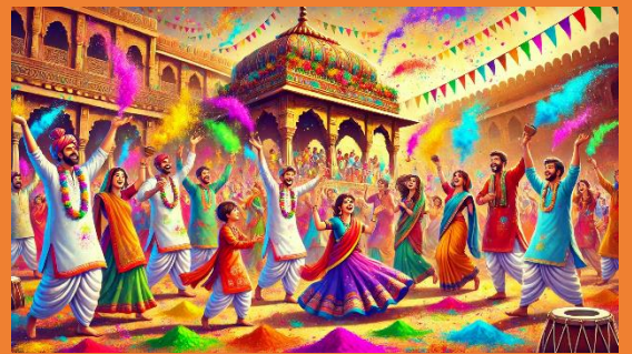
Rang Panchami 2026